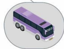
Автобус междугородного/международного следования